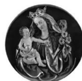
Maiandachten in der Seelsorgeeinheit „Oberes Achtal“ 2026