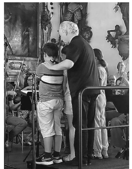
Text und Bilder: C. Zinser