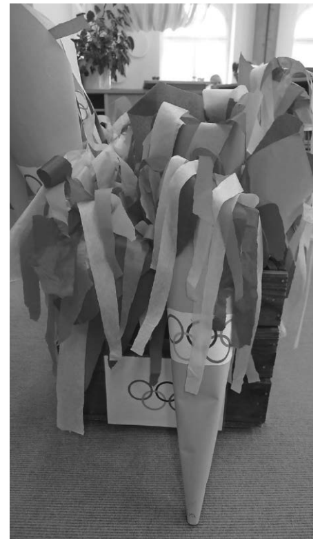
Olympische Fackeln der Kinder

Das Kindergartenteam St. Nikolaus Altann