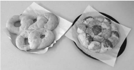
Gebackene olympische Ringe und Fußballbrot