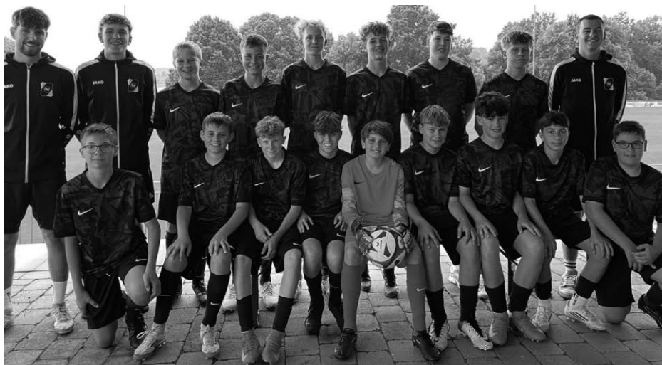
Die Jungs der C-Jugend und die Jugendabteilung vom SV Wolfegg