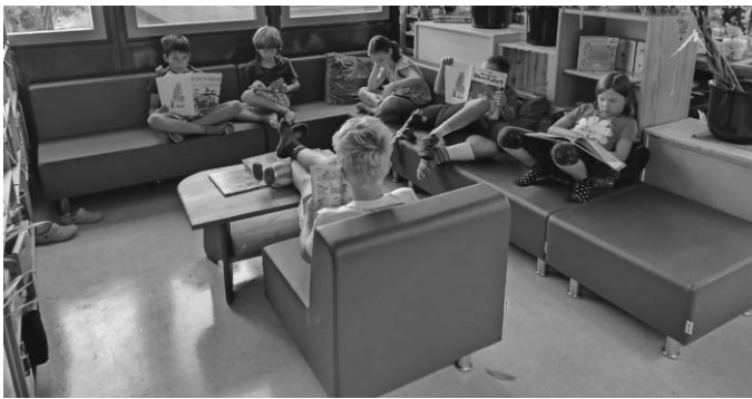
Unser schönes neues Sofa