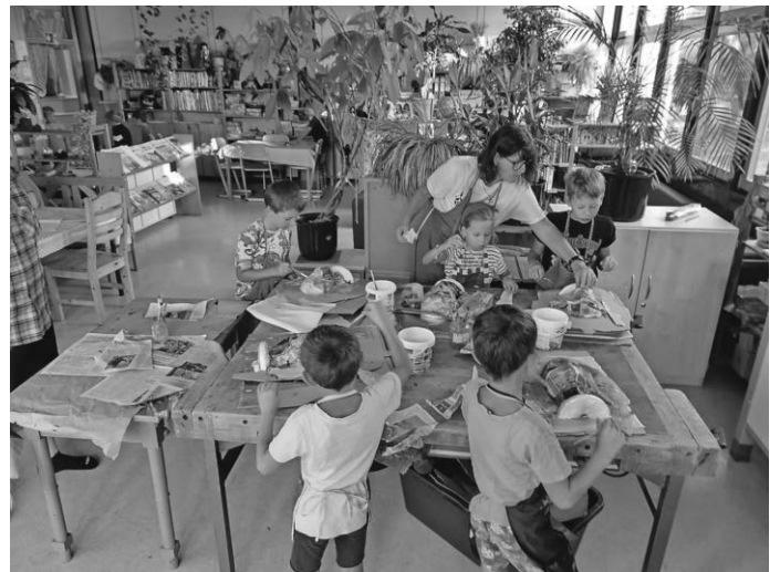
Beim Basteln der Pharaonenmaske