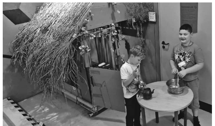
Druiden bei der Herstellung des Zaubertranks