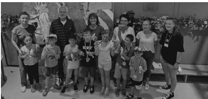
Die glücklichen Gewinner der olympischen Goldmedaillen