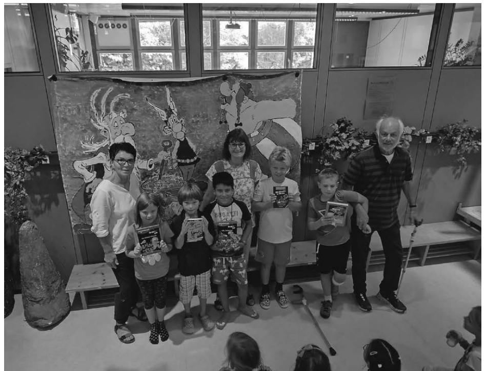
Die Sieger des Lesewettbewerbs der ersten Woche

In den letzten beiden Ferienwochen konnten jeweils 40 Kinder die berühmten Gal-