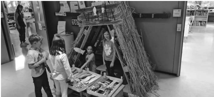
frische Fische des Fischhändlers Verleihnix