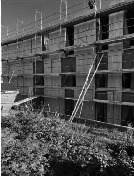
Außenansicht der neuen Flüchtlingsunterkunft in Wolfegg